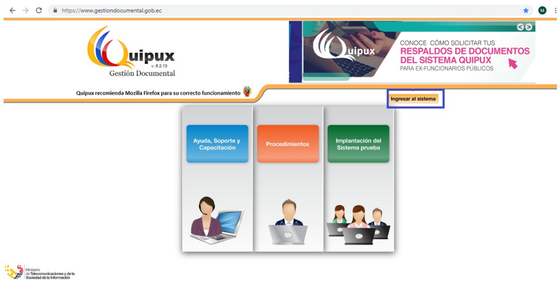
Gráfico 1: Página ingreso al sistema

La siguiente pantalla que aparecerá, le permite la autenticación como usuario del sistema, en esta instancia es donde se debe dar clic en el link: “ Olvidó su contraseña ”.