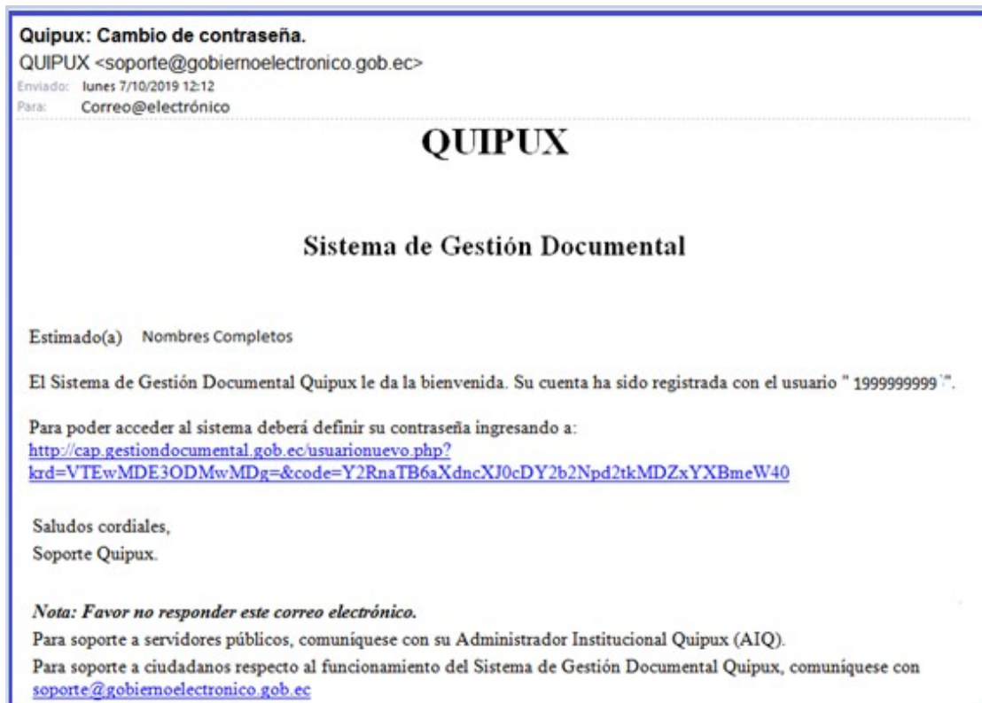
Gráfico 6: Correo para el ingreso de nueva clave

En la cuenta de correo registrada llegará un correo electrónico indicando el link para el ingreso de una contraseña, ver gráfico 6.