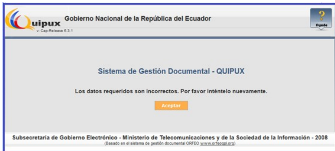
Gráfico 10: Pantalla de ingreso de datos incorrectos

En caso de que los datos de validación sean incorrectos muestra una pantalla con el error indicando que se debe intentar nuevamente.