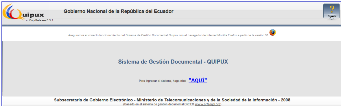
Gráfico 7: Link para cambio de contraseña

Luego de dar clic en el botón “AQUÍ” nos muestra una pantalla en la que debemos ingresar una contraseña que debe tener mínimo 6 caracteres y máximo 15 entre números y letras ver gráfico 8.