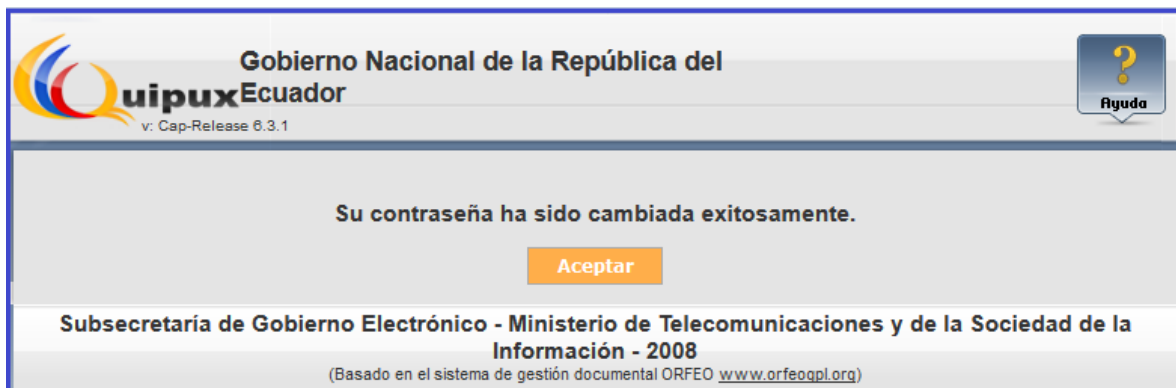
Gráfico 9: Mensaje informativo de cambio de clave exitoso

En caso de que los datos de validación sean incorrectos muestra una pantalla con el error indicando que se debe intentar nuevamente.