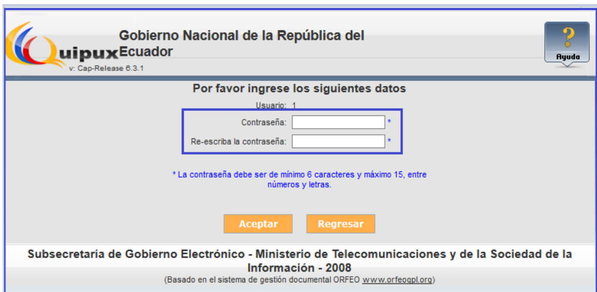
Gráfico 8: Ingreso de nueva contraseña

En el casillero Re-escriba la contraseña se debe confirmar la contraseña ingresada.