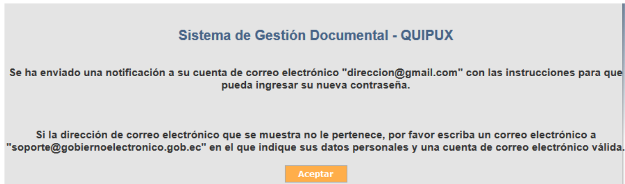
Gráfico 5: Pantalla de ingreso correcto de datos

En la cuenta de correo registrada llegará un correo electrónico indicando el link para el ingreso de una contraseña, ver gráfico 6.